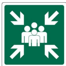
PUNTI DI RITROVO

Sono individuati quattro PUNTI DI RITROVO esterni dove, alla fine dell'EVACUAZIONE, sarà presente una figura provvista di radio; le aree sono contraddistinte dal seguente segnale